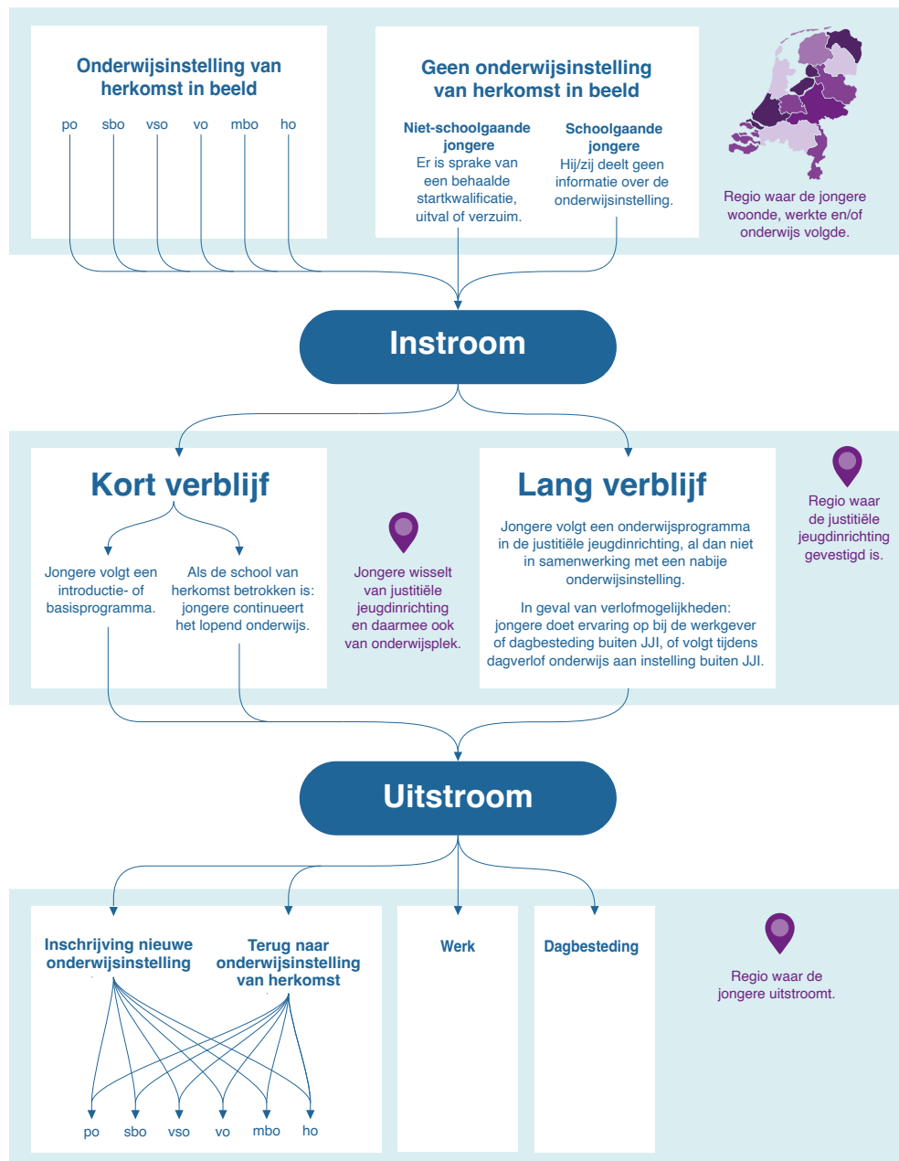
Figuur 3: Leerlingenstromen justitiële jeugdinrichtingen

De Onderwijsraad beveelt de overheid aan om JJI-scholen, onderwijsinstellingen van herkomst en ontvangende onderwijsinstellingen te stimuleren en beter in staat te stellen samen te werken bij instroom, uitstroom en nazorg (zie figuur 3).